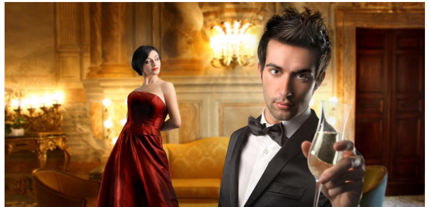
הסכם ממון בעשירון העליון