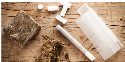
ייבא 182 יחידות חשיש ושחרר למעצר